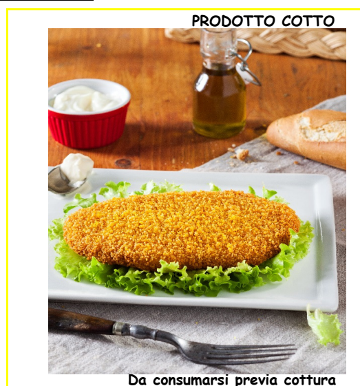
Da consumarsi previa cottura

La Ditta G.E. dichiara che la dicitura "Da consumarsi previa cottura" si riferisce alla sola riattivazione del prodotto e non a una completa cottura, in quanto il prodotto risulta già cotto secondo le procedure riportate sul Manuale HACCP.